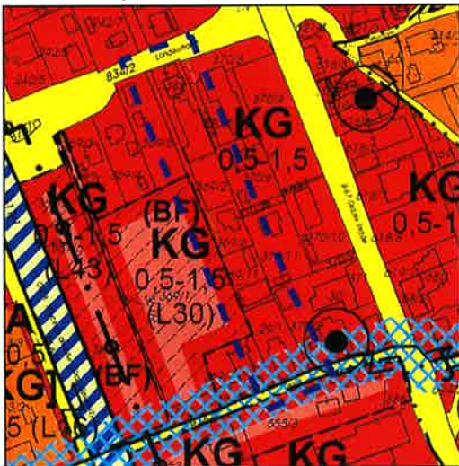
IST - Darstellung