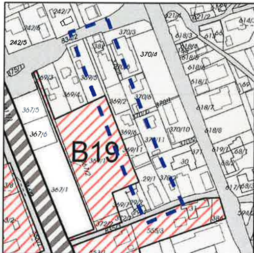
IST - Darstellung